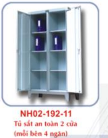
NH02-192-11 Tủ sắt an toàn 2 cửa (mỗi bên 4 ngăn)