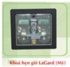
Khóa hẹn giờ LaGard (Mỹ)