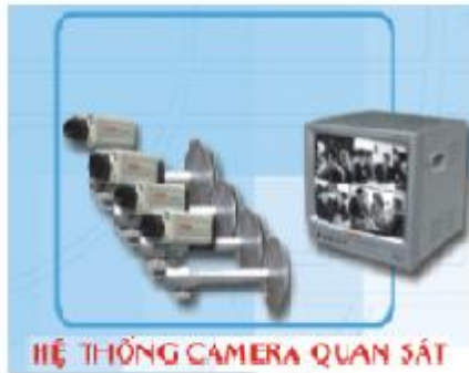
HIỆ THỐNG CAMERA QUAN SÁT