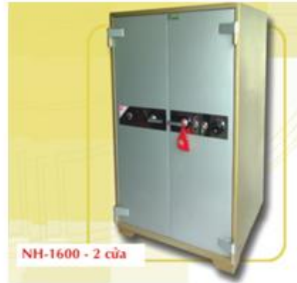
NH-1600 - 2 cửa