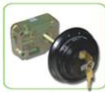
Ổ khóa mã số LaGard (Mỹ)