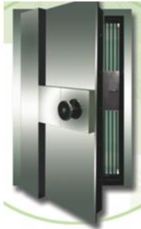
Cửa kho Ngân Hàng cấp 1,2